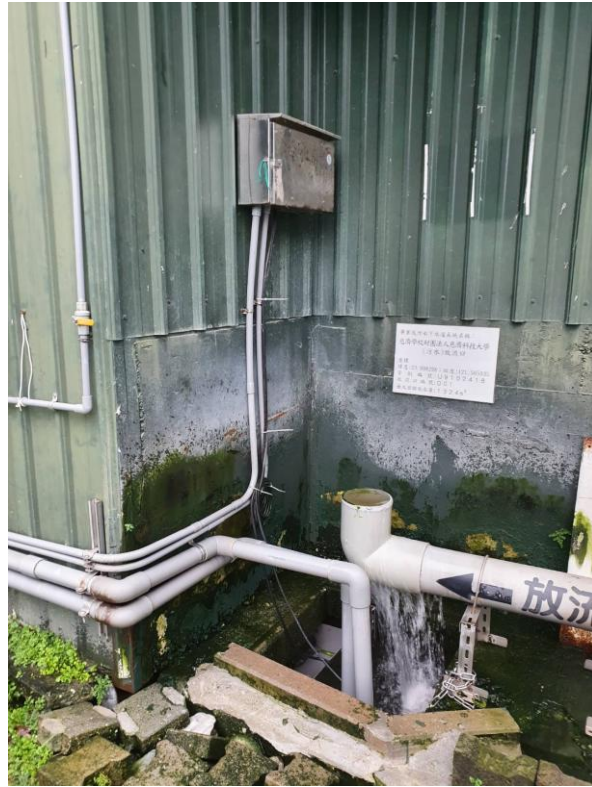
電源控制及放流口