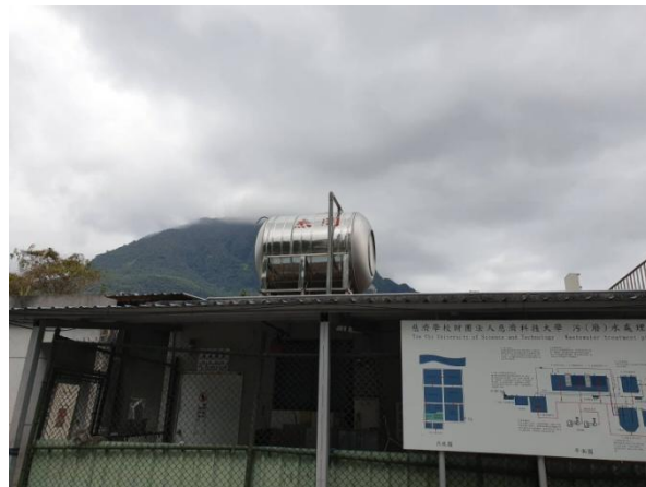
電源控制及放流口